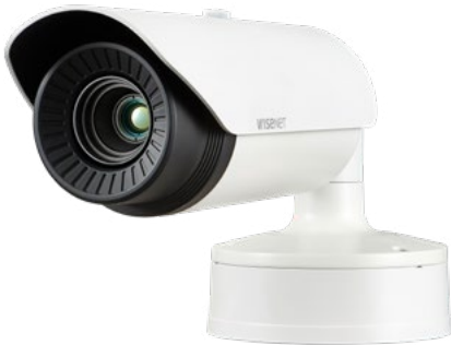
TNO-4030TR / TNO-4040TR

Caméra réseau thermique radiométrique VGA